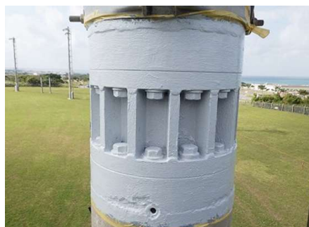
■ 継手部の防錆塗装(発錆対策)