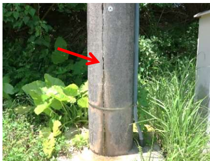
■ コンクリートのひび割れ