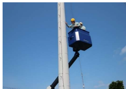
■ 地際から高所にわたる外観調査