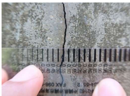
■ ひび割れ確認(クラックスケール)