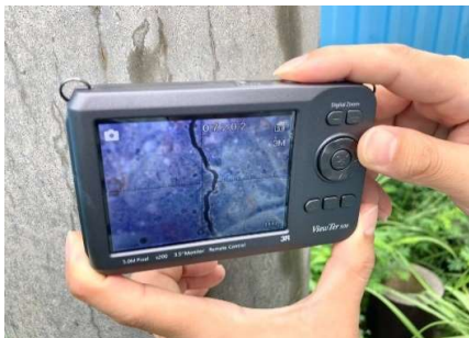
■ ひび割れ確認(デジタル顕微鏡)