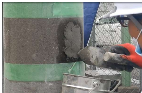
■ コンクリート部の断面修復